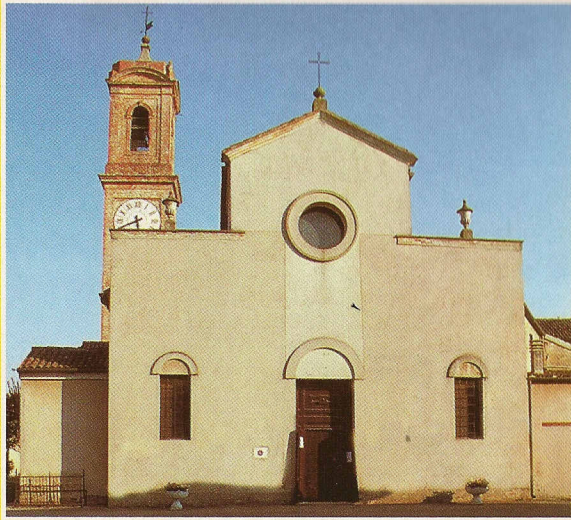
Chiesa parrocchiale di Voghiera.

Altra opera pittorica importante è collocata nell'altare di Santa Lucia, a sinistra dell'altar maggiore; si tratta di una pregevole tela dello Scarsellino (1550-1620) - recentemente restaurata a cura del Lions Club - raffigurante la Santa protettrice della vista che tiene nella mano sinistra una coppa ed una piuma. Sopra lo stesso altare e quello del Sacro Cuore sono presenti altre tele ovali sempre attribuite allo Scarsellino. La Natività di Maria è rappresentata da una statua in cotto dove la Vergine è in braccio alla madre S. Anna.